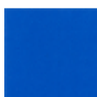
Bleu de prusse